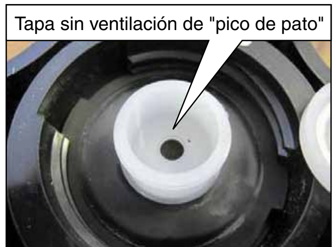
Figure 4. Tapa sin ventilación de "pico de pato"