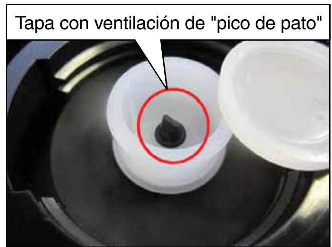
Figure 3. Tapa con ventilación de "pico de pato"